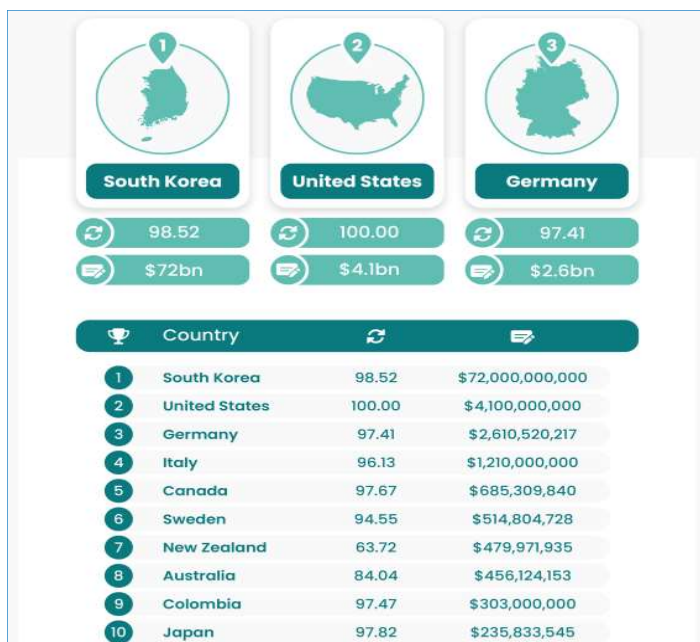
2-расм. “Глобал киберхавфсизлик индекси” натижалари

Бундан ташқари, АҚШда кибержиноятларни олдини олиш ва статистик маълумотлардаги сонни камайтиришга қаратилган чора-тадбирлар учун жуда катта маблағ сарфланади. Кибержиноятларга қарши курашишда “Глобал киберхавфсизлик индекси”да ривожланган давлатлар томонидан соҳага ажратилаётган маблағларни қуйидаги рейтингда кўришимиз мумкин (2-расм).